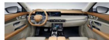
Бело - Бежевый